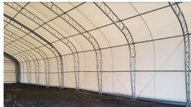
シート 1 層張り：材工価格